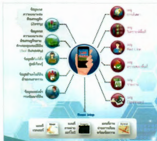
แผนผังระบบแผนที่ทางเลือกพืชเศรษฐกิจ

ระบบแผนที่ทางเลือกพืชเศรษฐกิจ (LDD Zoning) พัฒนาโดยศูนย์เทคโนโลยีสารสนเทศและการสื่อสาร ร่วมกับกองนโยบายและแผนการใช้ที่ดิน เป็นระบบที่พัฒนาขึ้นเพื่อให้เกษตรกร หรือบุคคลทั่วไปสามารถเข้าถึง ชั้นข้อมูลเขตความเหมาะสมพืชเศรษฐกิจ (Zoning) จำนวน ๑๓ ชนิดพืช โดยจัดระดับความเหมาะสมเป็น ๔ ระดับ ได้แก่ พื้นที่ที่มีความเหมาะสมสูง (S๑) พื้นที่ที่มีความเหมาะสมปานกลาง (S๒) พื้นที่ที่มีความเหมาะสมเล็กน้อย (S๓) และพื้นที่ที่ไม่เหมาะสม (N) และนำข้อมูลเขตความเหมาะสมพืชเศรษฐกิจ ตามลักษณะคุณสมบัติดิน (Soil Suitability) จำนวน ๑๓ ชนิดพืช ซึ่งแยกตามระดับความเหมาะสมเป็น ๔ ระดับ เช่นกัน ซึ่งผ่านการวิเคราะห์ข้อมูลแล้ว นำมาแสดงผลร่วมกับข้อมูลขอบเขตการปกครองระดับจังหวัด อำเภอ และตำบล ภาพถ่ายออร์โธรีตี ตำแหน่ง ข้อมูลแหล่งน้ำของกรมพัฒนาที่ดิน ข้อมูลกลุ่มชุดดิน ๖๒ กลุ่มชุดดิน ข้อมูลตำแหน่งของศูนย์การเรียนรู้ การเพิ่มประสิทธิภาพการผลิตสินค้าเกษตร ๘๘๒ แห่ง ศูนย์ถ่ายทอดเทคโนโลยีของกรมพัฒนาที่ดิน ข้อมูลสำมะโนที่ดิน ด้านเกษตรกรรม ของกรมพัฒนาที่ดินได้อย่างสะดวก ซึ่งผู้ที่สนใจสามารถเรียนรู้การใช้งานระบบแผนที่ทางเลือกพืชเศรษฐกิจ (LDD Zoning) ผ่านระบบออนไลน์ ที่มีเอกสารประกอบ ได้อย่างสะดวก ทุกที่ ทุกเวลา